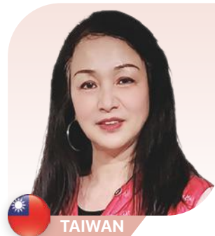
Yu Tzu Jou อีลิตอินฟลูเอนเซอร์ 1 สตาร์