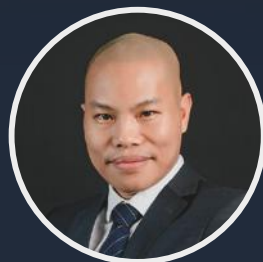
Le Hoan Vietnam