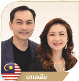
มาเลเซีย

เราร่วมเฉลิมฉลองความสำเร็จของพวกเขา โดย เน้นบทบาทสำคัญที่พวกเขามีต่อ Vyvo คอมมูนิตี้ มาร่วมกันยกย่องสมาชิกผู้ทรงอิทธิพลเหล่านี้ ที่ เป็นตัวแทนของจิตวิญญาณแห่งความมุ่งมั่นและ ความสำเร็จในเส้นทางของเรา